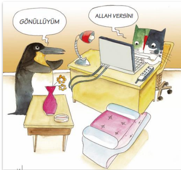
KARİKATÜR: STK'LAR İÇİN GÖNÜLLÜLÜK VE GÖNÜLLÜ YÖNETİMİ REHBERİ SİVİL TOPLUM GELİŞTİRME MERKEZİ (STGM)