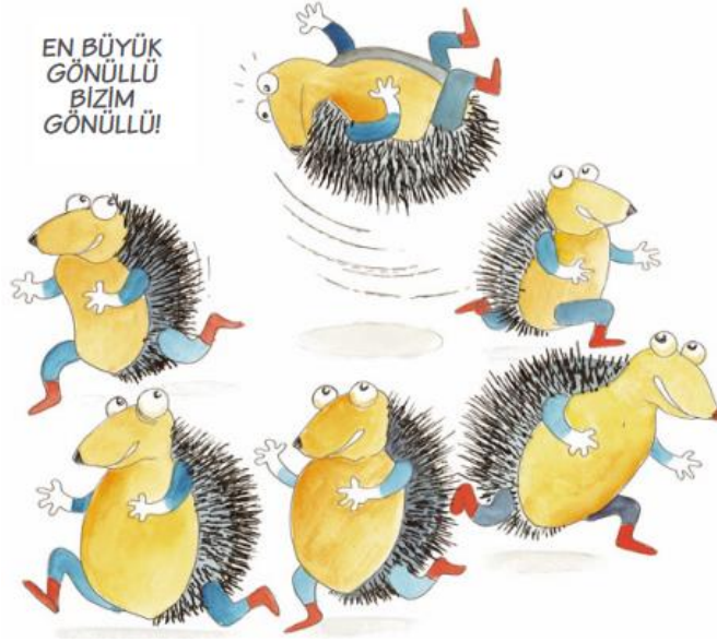
KARİKATÜR: STK'LAR İÇİN GÖNÜLLÜLÜK VE GÖNÜLLÜ YÖNETİMİ REHBERİ SİYİL TOPLUM GELİŞTİRME MERKEZİ (STGM)