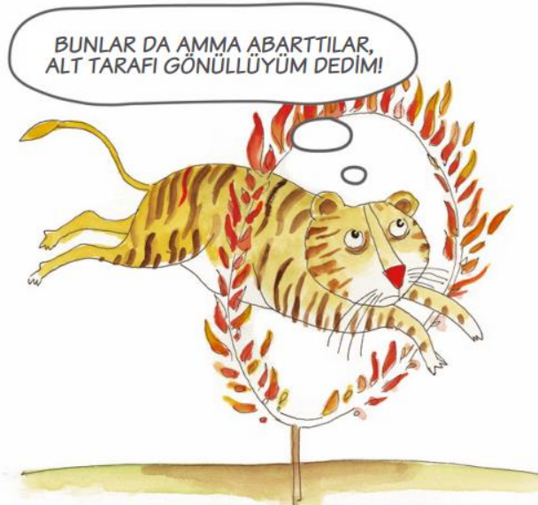
KARİKATÜR: STK'LAR İÇİN GÖNÜLLÜLÜK VE GÖNÜLLÜ YÖNETİMİ REHBERİ SİVİL TOPLUM GELİŞTİRME MERKEZİ (STGM)