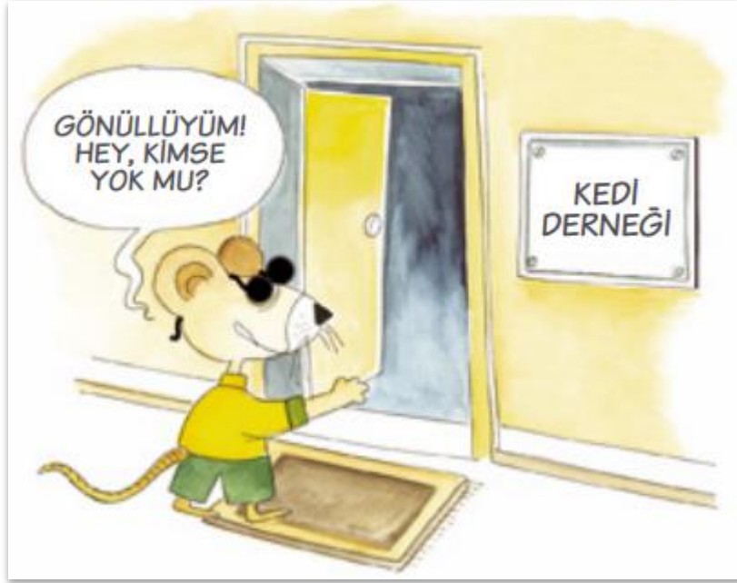
KARİKATÜR: STK'LAR İÇİN GÖNÜLLÜLÜK VE GÖNÜLLÜ YÖNETİMİ REHBERİ SİVİL TOPLUM GELİŞTİRME MERKEZİ (STGM)

Gönüllülük, bir bireyin maddi karşılık beklemeden ya da başka bir çıkar beklentisi içinde olmadan, ailesi ya da yakın çevresi dışındaki bireylerin yaşam kalitesini artırmak ya da genel olarak toplumun yararına olduğu düşünülen bir hedefe ulaşmak için, yalnızca içinden gelerek ve doğru olduğuna inanarak, bir toplumsal girişime ya da bir sivil toplum kuruluşu (STK) bünyesindeki etkinliklere destek olması biçiminde tanımlanabilir. Gönüllüler; bilgi, deneyim, enerji, hoşgörü, paylaşımcılık, iyi beşerî ilişkiler, profesyonel yaklaşım, sorumluluk üstlenme gibi niteliklere sahip olabileceği gibi, bu nitelikleri taşımadığı halde toplum için bir şey yapmak isteyen bireyler de olabilir. Bir gönüllünün taşıması gereken ilk ve vazgeçilmez nitelik samimi olarak “gönüllü” olmasıdır. (1)